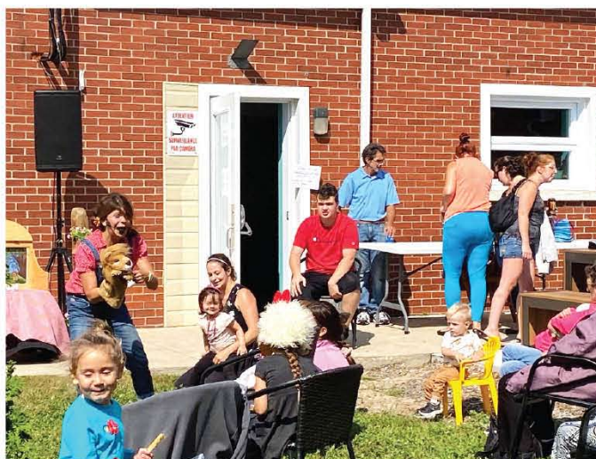
► Journée d'accueil du 14 septembre

Dame nature nous offre encore de belles journées d'automne! Venez profiter du parc de Ludolettre pour combler les besoins moteurs des enfants âgés entre 0 et 5 ans. Bienvenue à tous les citoyens et merci de prendre soin de nos infrastructures!