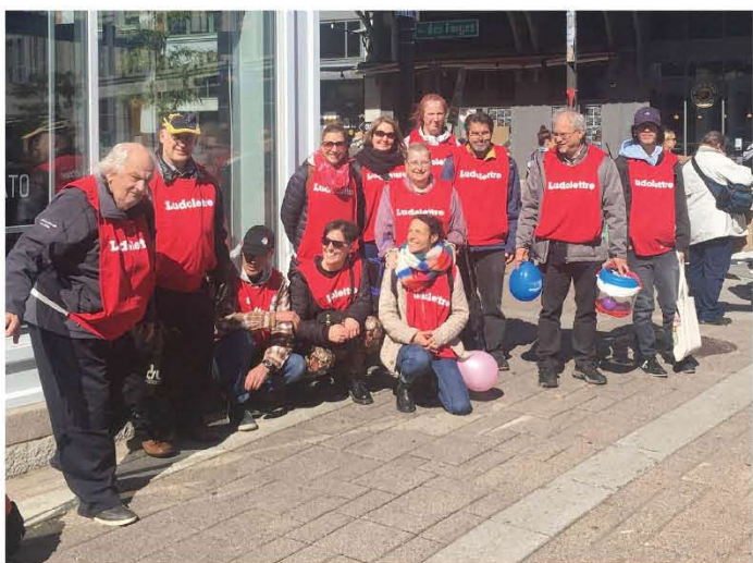
► Mobilisation du 29 septembre dernier

Pour plus de renseignements et inscriptions, appelez au 819 399-3023