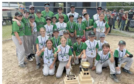
Séries U7-U-10 2025 Express blanc et Express vert U-10 finale