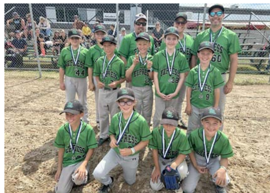
Séries U-7, U-10 2025 Express vert St-Léonard U-10 Finalistes séries éliminatoires