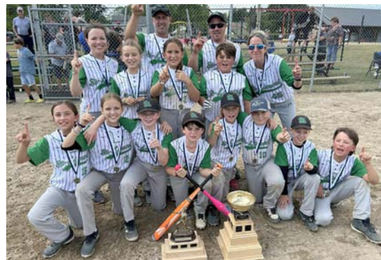
Séries U-7, U-10 2025 Express Blanc St-Léonard U-10 champions de la saison et des séries